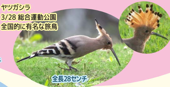
ヤツガシラ 3/28 総合運動公園 全国的に有名な旅鳥