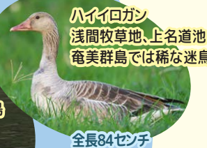
ハイロガン 浅間牧草地、上名道池 奄美群島では稀な迷鳥