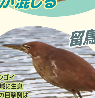
リュウキュウヨシゴイ 河川の中下流域に生息 しかし14年間の目撃例は 岡前半田橋周辺の1回のみ