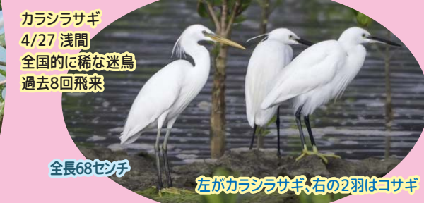
カラシラサギ 4/27 浅間 全国的に稀な迷鳥 過去8回飛来