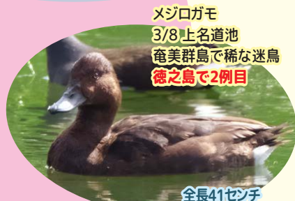
メジロガモ 3/8 上名道池 奄美群島では稀な迷鳥 徳之島で2例目