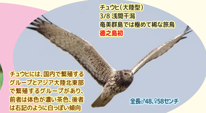
チュウヒ(大陸型) 3/8 浅間干潟 奄美群島では極めて稀な旅鳥 徳之島初