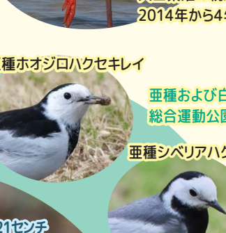
亜種ホオジロハクセキレイ