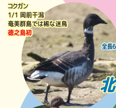
コクガン 1/1 岡前干潟 奄美群島では稀な迷鳥 徳之島初